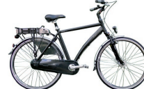
Wattworld : dès 1'950.- www.wattworld.ch