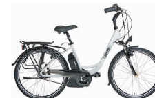
Gepida : dès 2'990.- www.belimport.ch