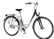
Raleigh : dès 2'999.- www.intercycle.com