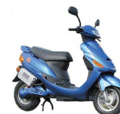
IO-Scooter : dès 4'200.- www.ioscooter.ch