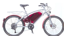
Dolphin : dès 3'980.- www.dolphin-ebike.ch