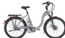
Flyer : dès 2'990.- www.flyer.ch