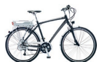
Villiger : dès 2'799.- www.villigerbikes.ch