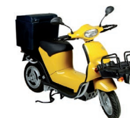
Oxygen : dès 10'400.- www.postscooter.ch