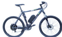
Crystallyte : dès 1'650.- (kit) www.crystallyte.ch