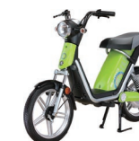
E-Ton : env. 3'000.- www.rg-group.ch