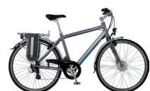
Giant : dès 2'499.- www.komenda.ch