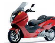
Vectrix : dès 12'490.- www.vectrix.ch