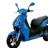
e-max : dès 4'990.- www.rg-group.ch