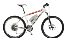
BionX : dès 1'790.- (kit) www.intercycle.com

(prix catalogue sous réserve de modifications)